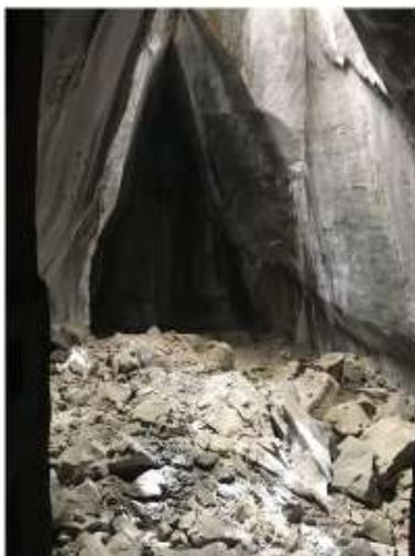
Külszíni akna alja, a bányából nézve.